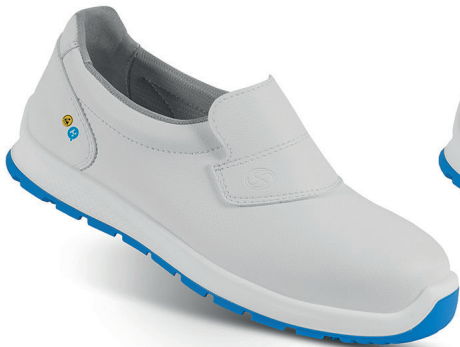
ALBA 95428-00 - Size: 35 - 42 ADRIA 94390-03 - Size: 38 - 48