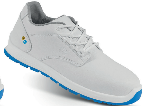
CHIUSI 95430-00 - Size: 35 - 42 CREMA 94394-02 - Size: 38 - 48

Sixton Peak®, synonyme de chaussures de travail de qualité supérieure, offre désormais une chaussure de très haute qualité aux travailleurs du secteur HORECA (hôtels, restaurants, catering), des industries agro-alimentaire et pharmaceutique, de l'électronique et des environnements aseptiques et médicaux, conçue comme un véritable bouclier contre les bactéries.