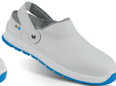
ALA 95429-00 - Size: 35 - 42 AVOLA 94389-02 - Size: 38 - 48